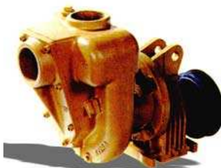
Pompa autoadescente con moltiplicatore di giri